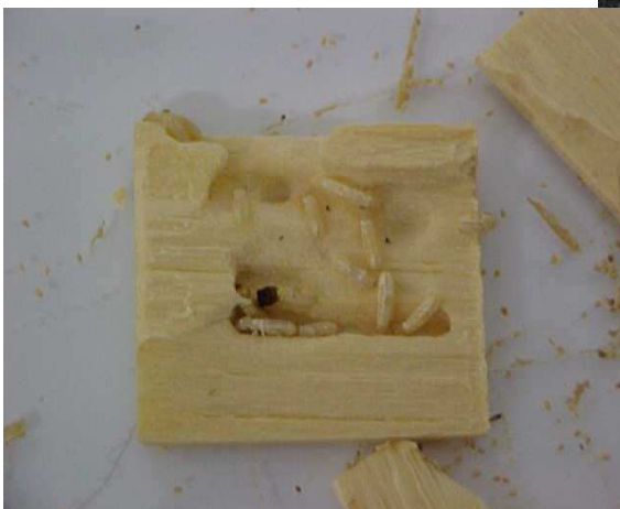
Abbildung 3: Termiten in den zersplitterten Testproben auf der Platte