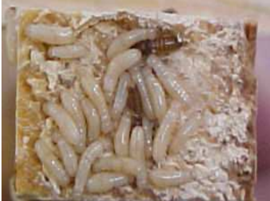
Abbildung 1: Nest von Cryptotermes brevis mit Königin (oben), König (unten) and Arbeiters.